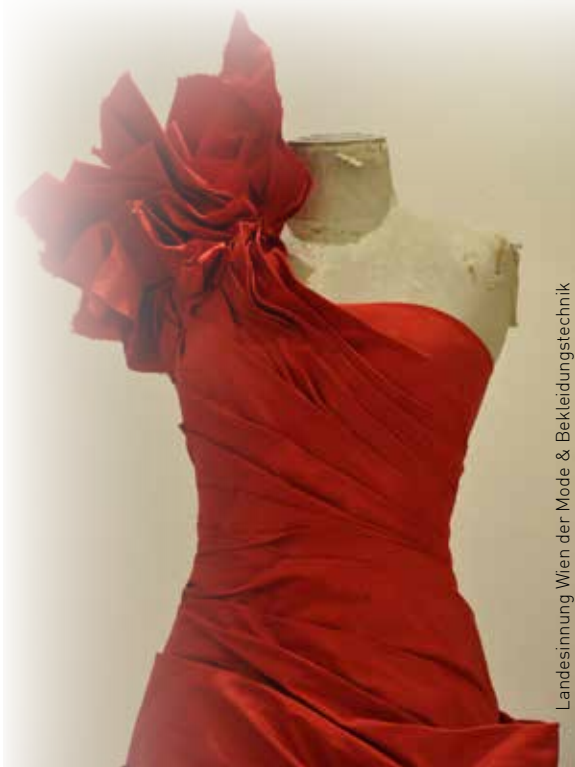
Landesinnung Wien der Mode & Bekleidungstechnik